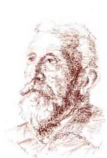
Eduardo Pondal 1965