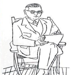
Luis Seoane 1994