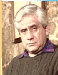
Avilés de Taramancos 2003