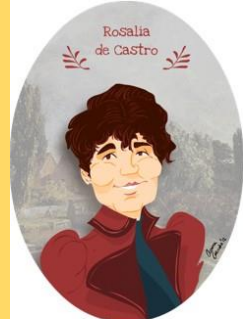
Rosalía de Castro 1963