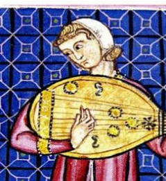
X. de Cangas, M. Códax y Mendinho 1998