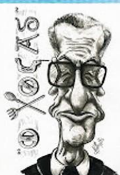
Xaquín Lorenzo, Xocas 2004