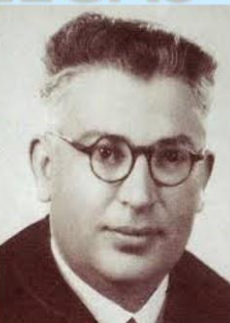
Aquilino Iglesia Alvariño 1986