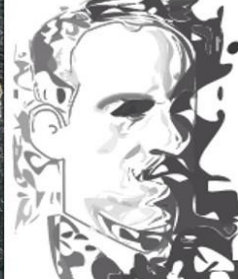
Antón Vilar Ponte 1977