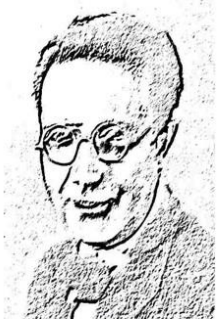
Daniel Rodríguez Castelao 1964