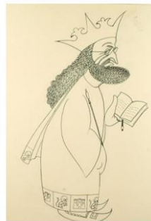
Alfonso X, el Sabio 1980