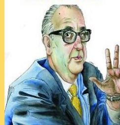
Álvaro Cunqueiro 1991