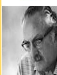
Valentín Paz Andrade 2008