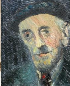
Ramón Cabanillas 1976