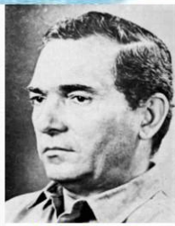
Valentín Paz Andrade 2005