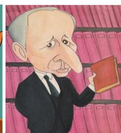
Xesús Ferro Couselo 1996